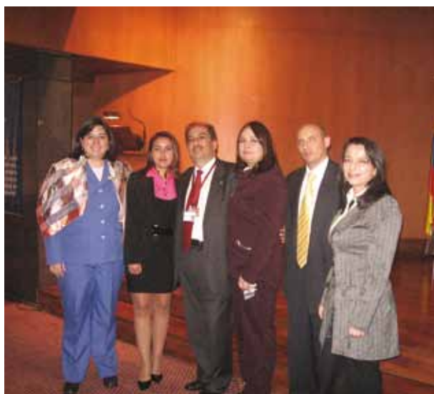
No encuentre el pie de foto de esta imagen!!!!