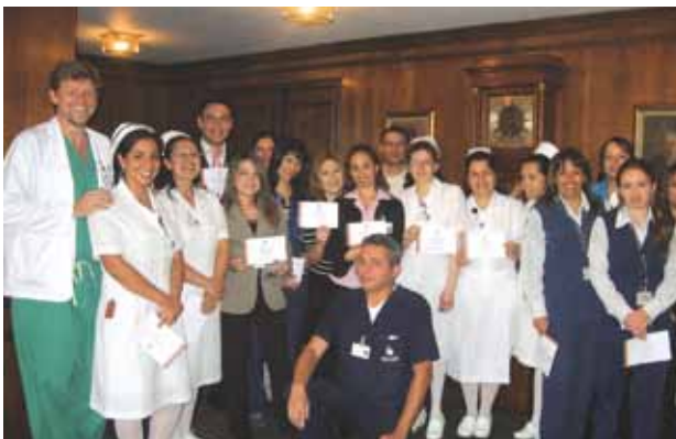
Entrega Certificados de participación en jornada de capacitación en Marly "Servir si Sirve"

En el tema de mercadeo se inició el proyecto de "Estrategia de Marca para la Clínica de Marly" para lo cual se seleccionó, luego de un análisis de varias propuestas, a Publicis Colombia como la agencia que nos dará la carta de navegación que nos permita imprimirle energía y rejuvenecimiento a nuestra imagen y marca. En la primera etapa de diagnóstico se han realizado varias sesiones de trabajo con la participación de directivos y médicos amigos de nuestra institución. Continuaremos trabajando en lo que resta del año 2009 para que la estrategia que se defina permita lograr nuestras metas y objetivos a corto y largo plazo.