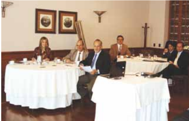
Trabajo de Grupo "Estrategia de Marca Clínica de Marly S.A. Club el Nogal. Mayo 15 de 2009