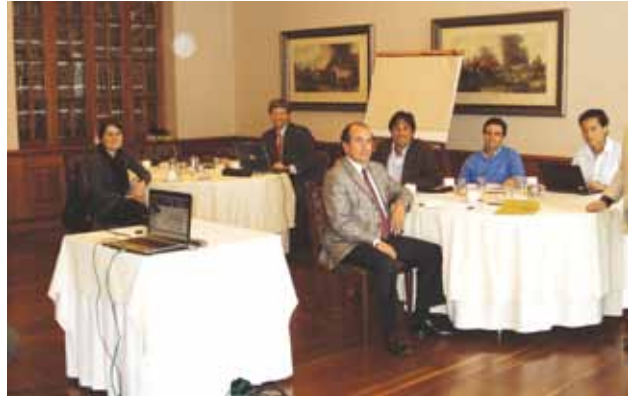
Trabajo de Grupo "Estrategia de Marca Clínica de Marly S.A. Club el Nogal. Mayo 15 de 2009