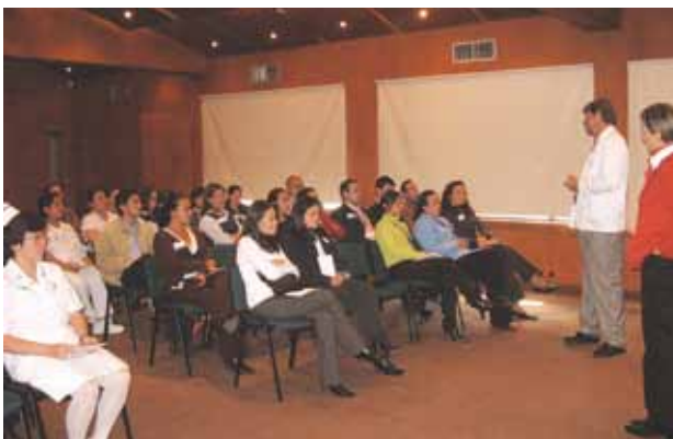
Bienvenida, Capacitación en Marly "Servir si Sirve"

Como parte importante también de su labor diaria, la Oficina de Atención al Cliente ha continuado con su función de consolidación y análisis de la información obtenida a través de las encuestas de satisfacción, obteniendo un aumento importante en el porcentaje de respuesta a las mismas especialmente en los servicios de urgencias y radiología.